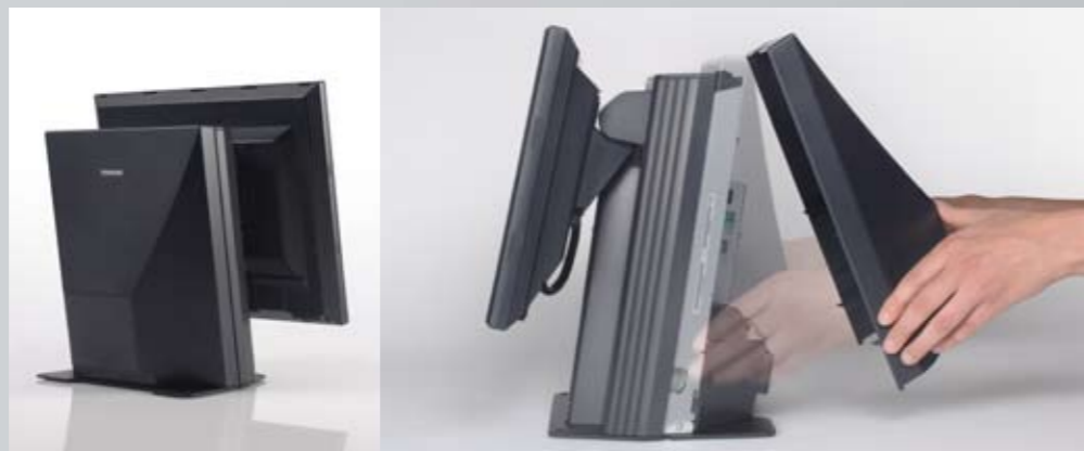
Einfachste Wartung durch Klick-Verschluss

Der preisgekrönte ST-A10 TouchPOS von Toshiba bietet bei minimalem Platzbedarf eine breite Funktionspalette. Benutzerfreundliche Klick Verschlüsse sowohl am Gehäuse als auch bei den Komponenten machen die Wartung zum Kinderspiel. Intelligente ergonomische Funktionen ermöglichen eine Beschleunigung des Bezahlvorgangs an der Kasse.