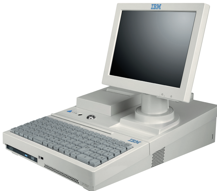
IBM SurePOS 100-Modell 118